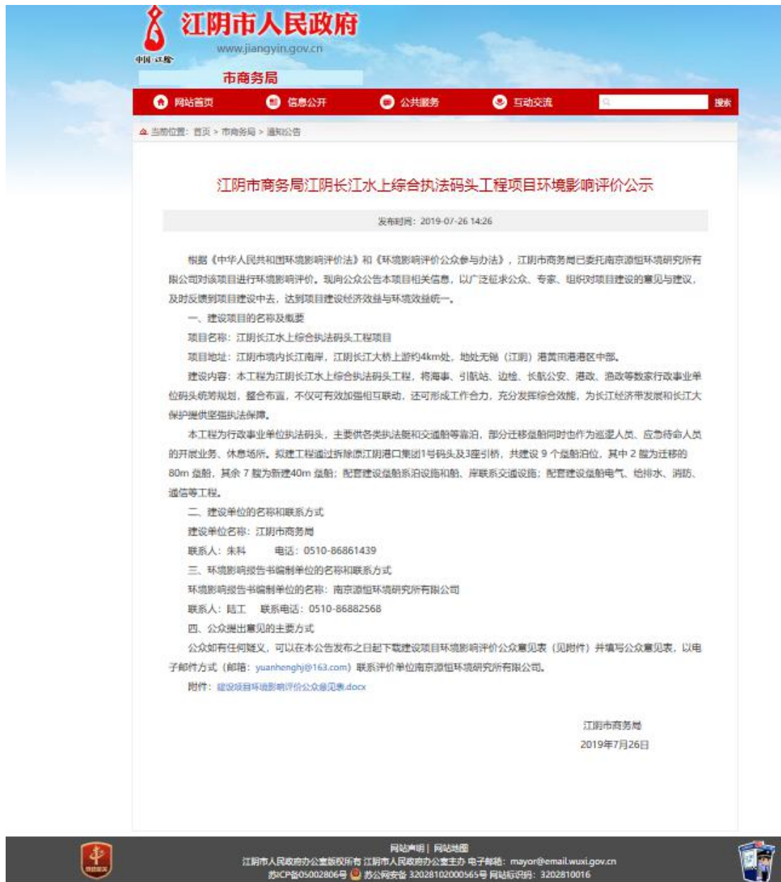
图 1 首次网络公示截图