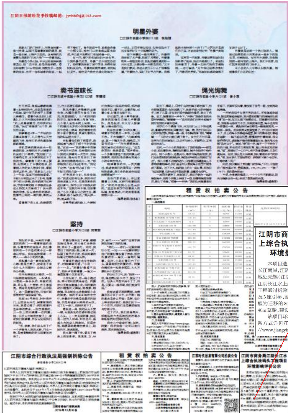
图 3 第一次报纸公示截图

《江阴日报》坚持“党报性质、晚报风格”的办报特色，当好江阴市委市政府和人民群众的喉舌，为江阴经济社会的飞速发展营造了良好的舆论环境。